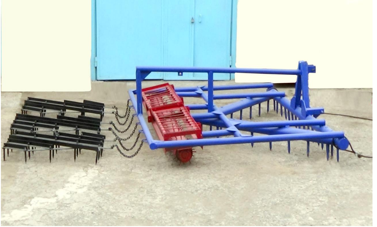
Kombin edilmiř diřli mala